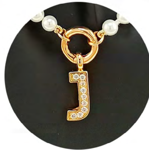
REF. 206959 SHORT NECKLACE WITH LETTER PENDANT IN GOLD PLATED 18K WITH SWAROVSKI STONES AND MAJORCA PEARLS.