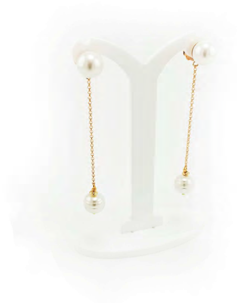
EARRING 1 LANE WITH CHAIN AND IN GOLD PLATED 18K AND MAJORCA PEARLS.