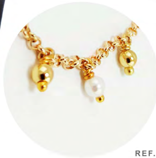
REF. 206970 SHORT NECKLACE WITH METAL PARTS AND CLASP IN GOLD PLATED 18K WITH MAJORCA PEARLS.