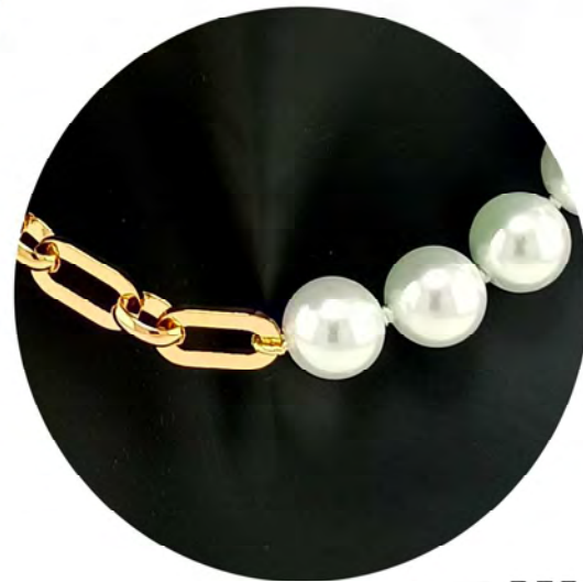
REF. 206964 SHORT NECKLACE WITH CHAIN, METAL PARTS AND CLASP IN GOLD PLATED 18K WITH MAJORCA PEARLS.