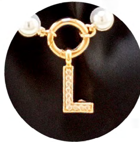
REF. 206958 SHORT NECKLACE WITH LETTER PENDANT IN GOLD PLATED 18K WITH SWAROVSKI STONES AND MAJORCA PEARLS.