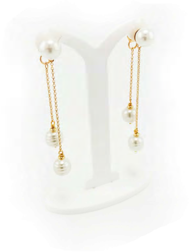
EARRING 2 LANES WITH CHAIN AND IN GOLD PLATED 18K AND MAJORCA PEARLS.