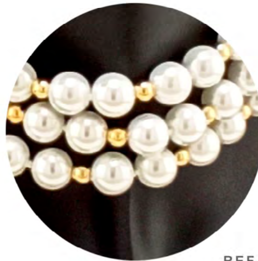
REF. 207292 SHORT NECKLACE 3 LANES WITH METAL PARTS, CLASP AND CHAIN IN GOLD PLATED 18K WITH MAJORCA PEARLS.